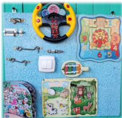
Бизиборд «Умелые ручки»